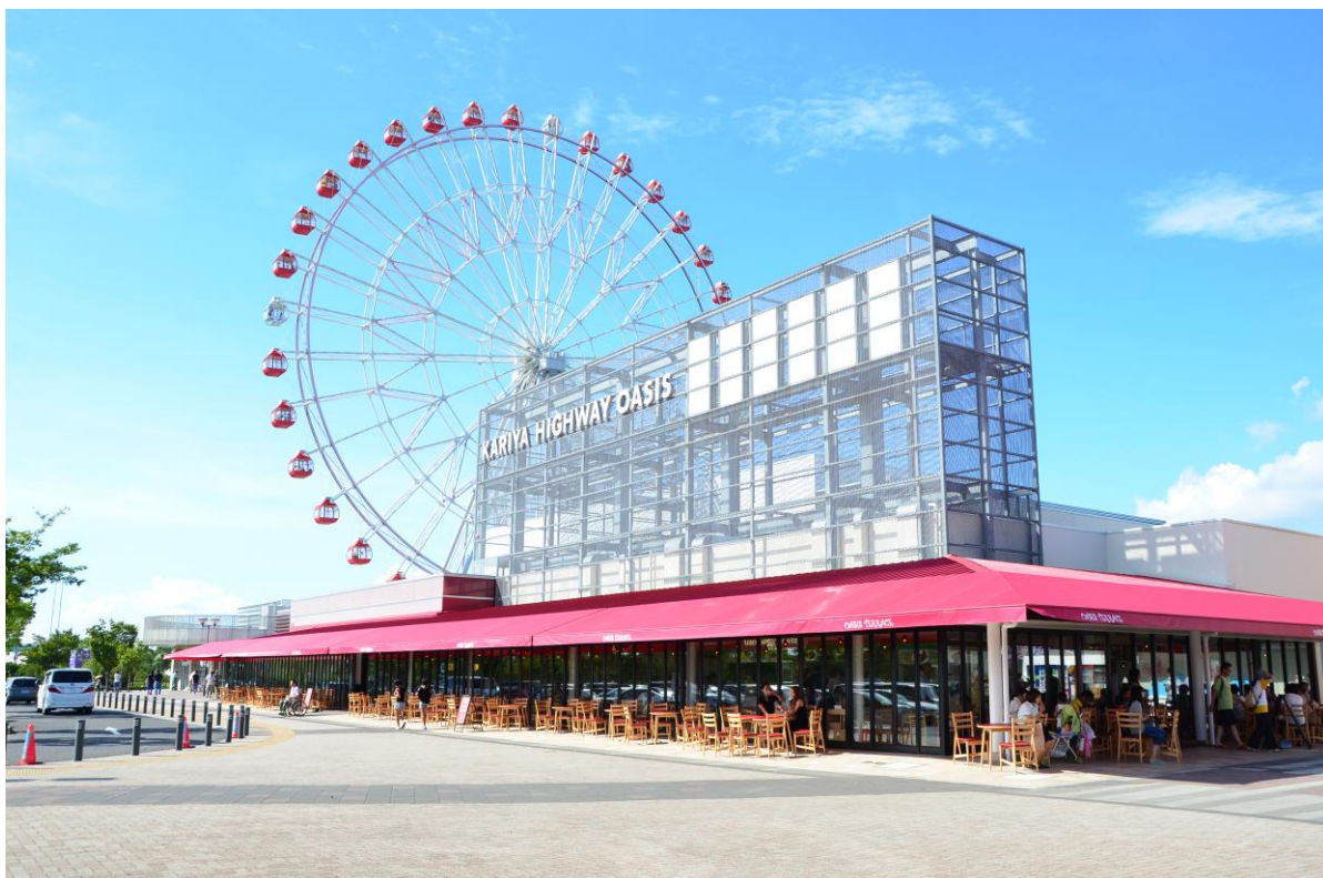
刈谷ハイウェイオアシス