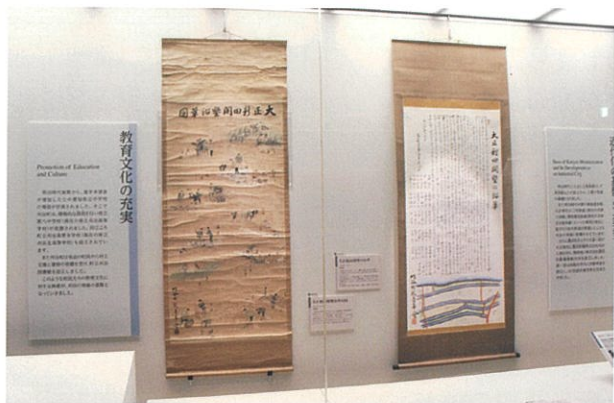
▲ 歴史ひろば（常設展示室）にて展示されている「大正新田開墾沿革図」（左）と「大正新田開墾の沿革」（右）

刈谷市歴史博物館が建つのは「刈谷市逢妻町」ですが、この町名は逢妻川に沿った地域であることに由来します。江戸時代以前、この辺りは衣ヶ浦と呼ばれる入江が広がっていましたが、江戸時代以降土砂の堆積により徐々に埋まっていき、入江から川と湿地へ姿を変えていきました。このような土地は開墾に適しており、いわゆる「新田開発」が盛んに行われています。