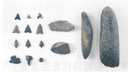
▲ 刈谷市本刈谷貝塚出土の縄文石器 (当館蔵)

縄文時代になると、押圧剥離技術による石器製作が発達したことや研磨技術を用いた石器などが作られるようになります。押圧剥離技術は旧石器時代終末に登場していましたが、縄文時代になると石鏃や石匙などの小形石器を製作する技術として発達します。押圧剥離は加工したい部分に鹿角の先端などを当て、圧力で剥離することで細かく複雑な加工を行うことができるので、石刃のように決まった形の剥片を素材にして石器作りを行う必要がなくなりました。これによって不揃いな剥片に細かな加工を施して形を整える石器製作が一般的になります。