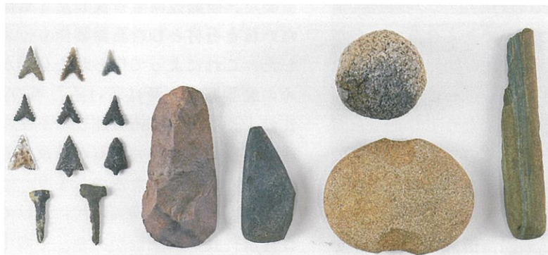
▲中条遺跡出土の石器(当館蔵)

刈谷市では旧石器時代から縄文時代にかけての遺跡が発掘されており、これらの遺跡では石器もたくさん見つかっています。当時の人々にとって石器は生活道具の中心であり、なくてはならないものでした。石器は山や川などで採集された石を加工して作られましたが、時代の変遷によって作り方や使い方なども変化していきました。