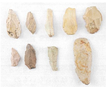
▲ 豊川市駒場遺跡出土の旧石器 (豊川市桜ヶ丘ミュージアム蔵)

後期旧石器時代の特徴的な石器製作技術の一つに「石刃技法」と呼ばれる技術があります。石刃技法は「石刃」という縦長剥片を連続して剥離する技術で、同じ規格の石器を量産することができる技です。前・中期旧石器時代では一つの石から一つの石器、または数個の石器しか作ることができませんでした。後期旧石器時代になると石刃技法の開発により、原石の大きさにもよりますが、一つの石からたくさんの石器を作ることができるようになりました。石刃技法によって量産された石刃はそのままでも使用で