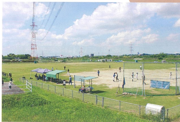
▲ 大正新田の跡地（推定）、現在はグラウンドとなっており、当時の姿をしるばせる痕跡はない

この「大正新田開墾の沿革」は古書店から購入し、展示に際し修理とクリーニングを施したもので、制作当時の色鮮やかな様子が再現されています。一方の「大正新田開墾沿革図」は地元から寄贈された資料ですが、開墾の過程が絵で描かれています。絵は熊出身の挿絵画家である河目悌二（1889 - 1958）を彷彿とさせる穏やかなタッチですが、海嘯の様子も描かれており、作物を失った悲しみも伝わってきます。この2点はいずれも「刈谷町熊青年会」の揮毫があり、内容も一致することから（対になるとまでは言い切れませんが）同時期に制作されたものでしょう。この文章と絵からは若者たちの力、そして事業を終えた歓喜の様子がひしひしと感じ取れます。