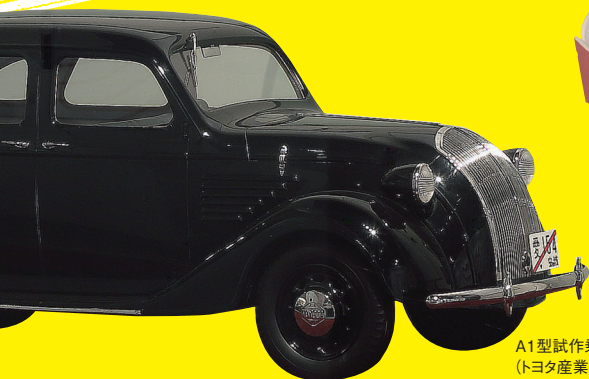
A1型試作乗用車(5分の1スケール) (トヨタ産業技術記念館蔵)