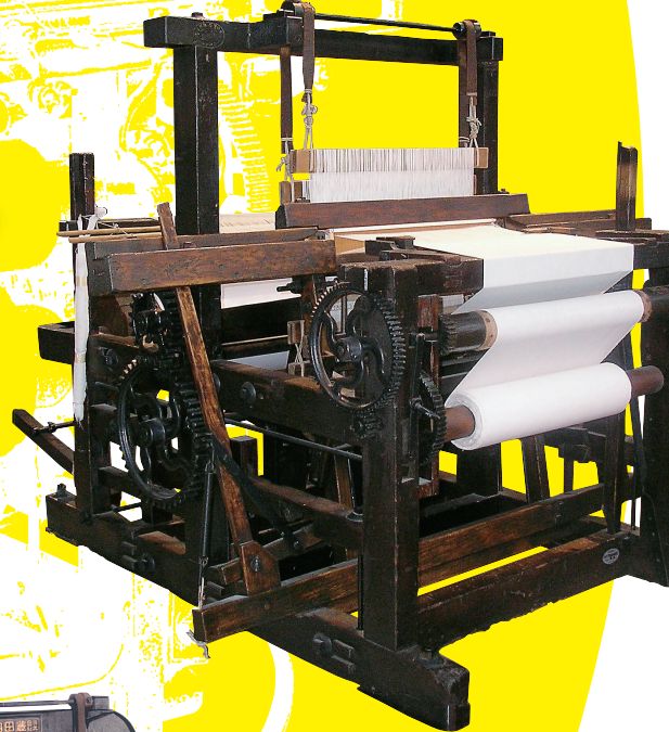
豊田式汽力織機(複製) (トヨタ産業技術記念館蔵)