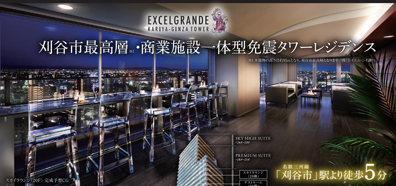
スカイラウンジ(20F) 完成予想CG

※1.本建物の高さ(は約95mとなり、刈谷市最高層となります。(株)シイエム・シイ調べ