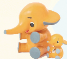
▲「サトちゃん」人形 1960年代

申 5月10日(金)（必着）までに、往復ハガキの往信部裏面にイベント名、参加者全員の氏名（フリガナ）・年齢、住所、電話番号を、返信部表面に氏名、郵便番号・住所を記入し、美術館（〒448-0852 住吉町4-5）へ。