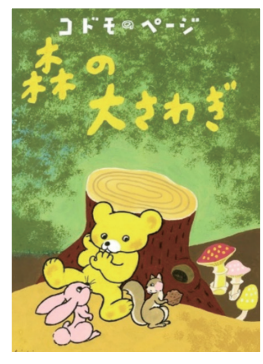
▲「森の大きわざ」原画 1950年