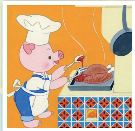
▲「テレビえばなしブーフーウー」原画(部分)1964年

※身体障害者、精神障害者保健福祉、療育の各手帳所持者および付き添いの人（1人）は入場無料。入館の際に手帳を提示してください。