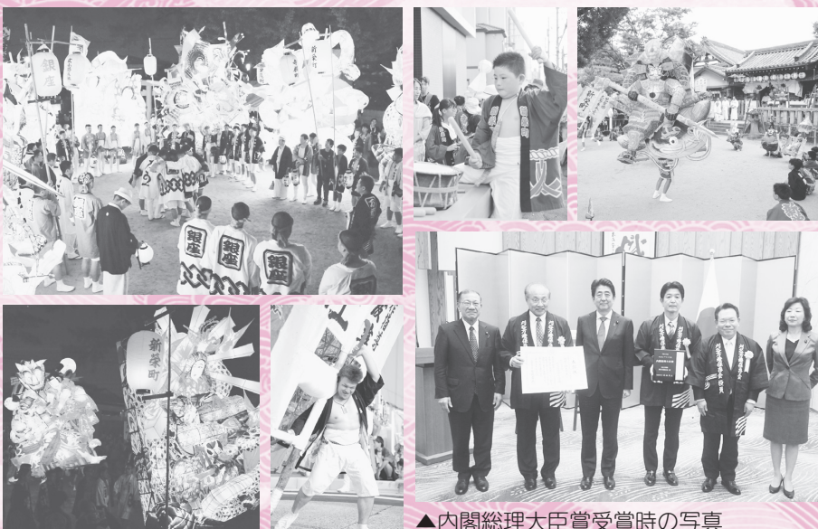
▲内閣総理大臣賞受賞時の写真

一般財団法人 地域活性化センター主催の第22回ふるさとイベント大賞において、全国からの応募総数125イベントの中で、万燈祭が愛知県としては初の大賞(内閣総理大臣賞)を受賞しました。