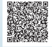
▲あいち電子申請・届出システム