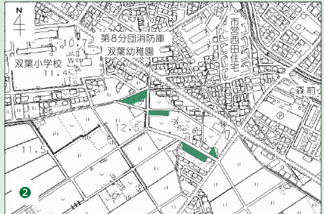
②半城土町(山ノ腰の一部)