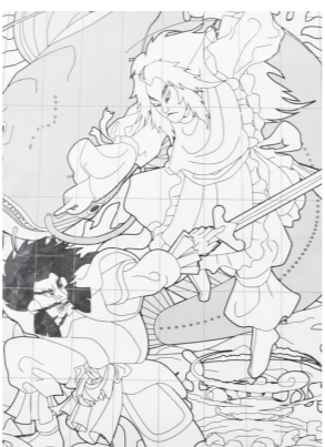
国譲り 建御雷と建御名方