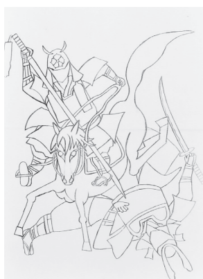
明智光秀、信長を討つ