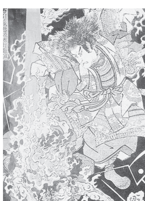
布引ノ滝 悪源太義平