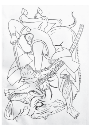
山本勘助 イノシシ狩り