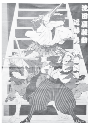
池田屋騒動 近藤勇、沖田総司