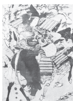
巴御前 粟津の戦い