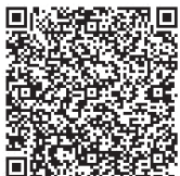
▲あいち電子申請・届出システム

定 30組(最大80人・先着順) 申 10月4日(金)9時から22日(火)17時までに、あいち電子申請・届出システム(QRコード参照)または直接、館内窓口(☎水曜)へ。