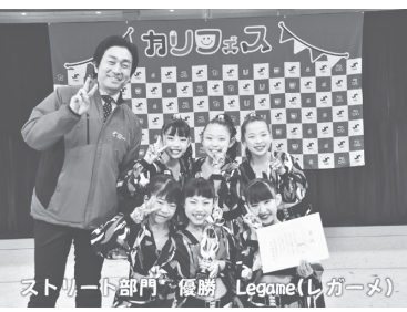
ストリート部門・優勝 Legame(レガーム)

時 1月18日(日) 9時~17時 場 総合運動公園 内 ダンスやサッカーをはじめ、豊田自動織機シャトルズによるラグビー体験などさまざまなスポーツを楽しめます。キッチンカーやワークショップなどもあります。