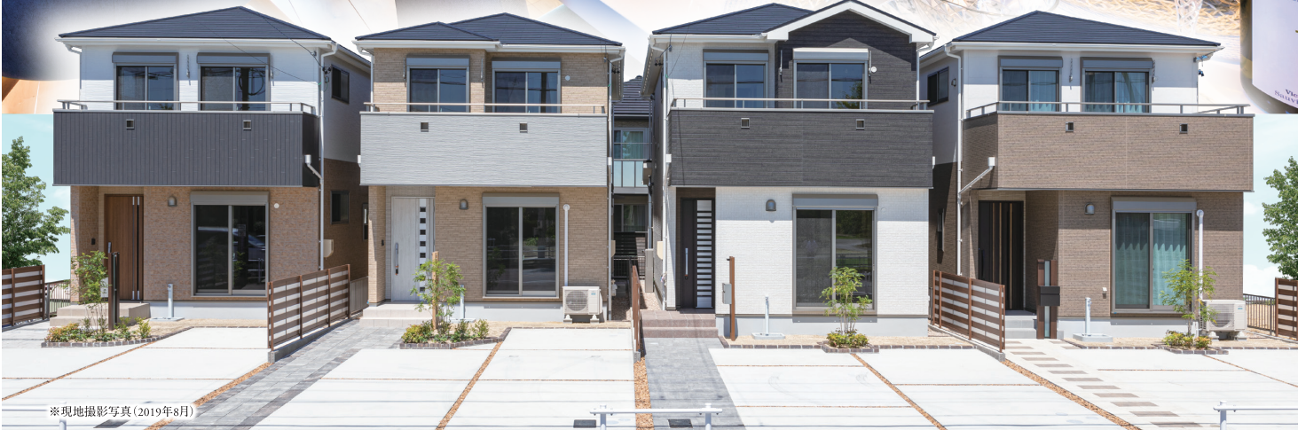
※現地撮影写真(2019年8月)