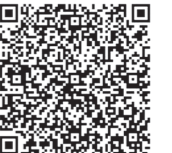
▲あいち電子申請・届出システム

時 10時~12時 場 総合文化センター 対 市内在住、在勤または在学の育児中の女性 定 25人 料 ¥ ④500円、⑤1,400円 申 4月22日(必着)までに、①「子育てカレッジ」希望、②郵便番号・住所(市外在住の人は勤務先なども)、③氏名(フリガナ)、④年齢、⑤電話番号、⑥託児を希望する人は、子どもの氏名(フリガナ)・性別・生年月日をハガキ、FAX(27-9652)、Eメール(kyodo@city.kariya.lg.jp)、あいち電子申請・届出システム(QRコード参照)または直接、市民協働課(〒448-8501 刈谷市役所)へ。