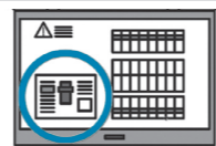
分電盤タイプ(後付形)