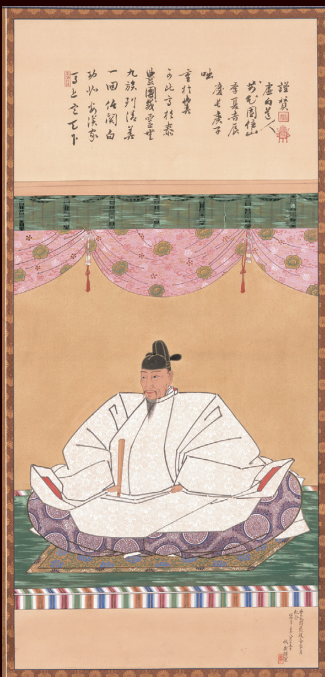
▲豊臣秀吉画像 (山田秋衛模写) [名古屋市博物館蔵]