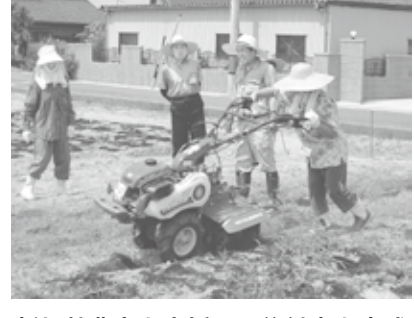
新規就農者を支援し、後継者を育成