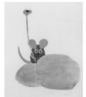
レオ・レオニ『フレデリック』1967年 Frederick©1967, renewed 1995 by Leo Lionni/Pantheon Works by Leo Lionni, On Loan By Lionni Family