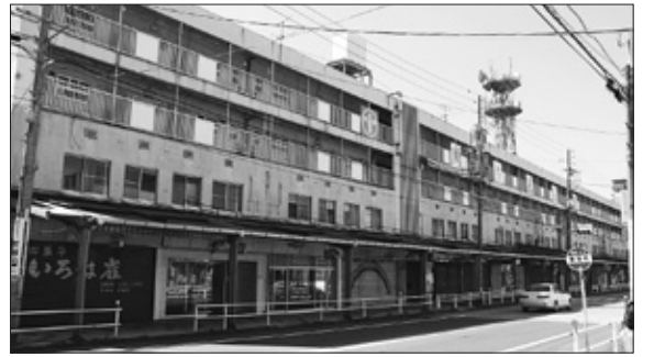
平成26年度に取り壊し予定の東陽町名店街ビル

問 一ツ木町に平成27年度に開設を予定する民間保育所の運営法人は、どういった法人か。