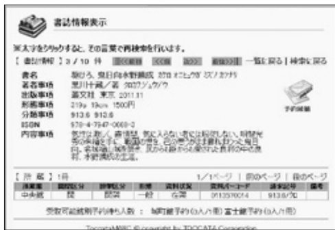
図書館のホームページから蔵書を検索