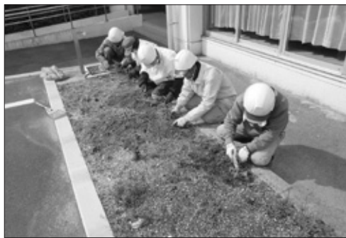
元気に働く高齢者の様子

問 高年齢者の経験やニーズにマッチした、より魅力的な職域の開発を進めてはどうか。 答 IT知識等、既存の職種経験を活かせることは、高齢者が生きがいを持って、社会参加できることにより、高齢者による社会支援の一翼を担えるものと考えている。