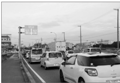
平成大橋渋滞の様子

問 井ヶ谷町沼田交差点は、市内で渋滞長が最も長い調査結果があるが、その一因が豊明インターから降りた車が沼田の信号を通り豊田市に向かうことで渋滞を起こしていることから、