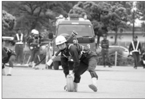
消防操法競技会の様子

問 消防団の装備基準が改正されたことにより、どのような対応をしていくのか。 答 防火手袋、AED、エンジンカッターや伝達用トランシーバーなどの装備品を、消防、防災活動における使用頻度や操作性などを考慮し、計画的に装備の充実を図っていく。