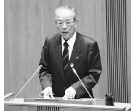
施政方針演説を行う市長

(平成26年度主要事業の中から新規事業を中心に掲載。全ての主要事業は、市のHPから参照できます。)