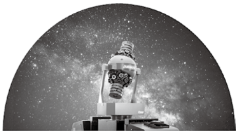
夢と学びの科学体験館 HANDS-ON SCIENCE MUSEUM

最新のプラネタリウムを導入することにより、「迫力ある美しい投映」を可能にする機能