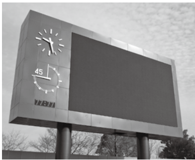
電光掲示盤の多目的活用を期待

電光掲示盤の設置に伴い設備費が必要となるものの、上昇したコスト分を使用料として市民に転嫁することには反対であるとの意見がありました。採決の結果、可決することに決定しました。