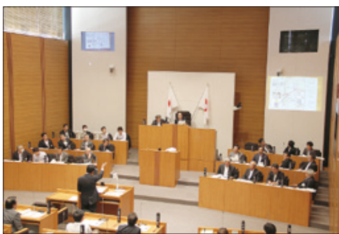
書画カメラを活用した一般質問

○議会の役割 議会は、市の議決機関として、大規模災害発生などの非常時においても、その機能を維持することが求められます。 具体的には、災害関連予算などの市の方策が市民にとって最善の内容であるかを迅速に審議して決定します。また、市民への情報提供や、集約した被災情報に基づき市や国・県等に復旧・復興に関する要望や提言を行うなど、市民と行政を結びつける役割を担います。