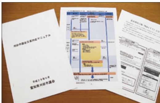
刈谷市議会災害対応マニュアル

○策定の目的 東日本大震災や熊本地震など、全国各地で自然災害による大きな被害が発生している中、本市においても南海トラフ巨大地震や大型台風などの発生が懸念されています。大規模災害発生時に議会が担う役割を明確にし、市と協力・連携して、災害対応に当たるために、本マニュアルを策定しました。