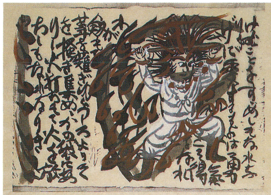
大和し美し 倭建命の柵