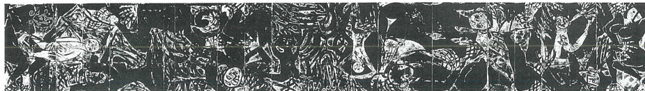
世界最大の板画「大世界の柵」乾・坤2部作