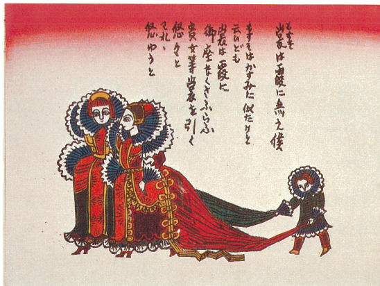
星座の花嫁 貴女・裳を引く