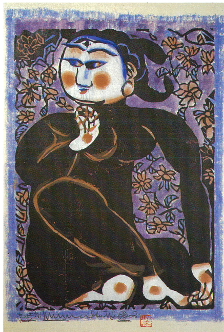
鐘溪頌・倭桜の柵