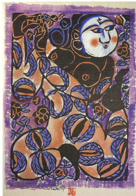
鐘溪頌・若栗の柵