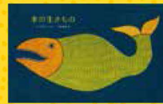
「水の生きもの」(河出書房新社)