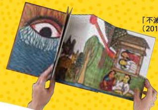
「不滅の箱船」(2012年初版)