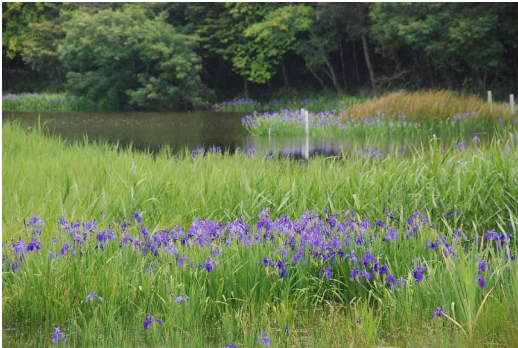
カキツバタ（小堤西池）