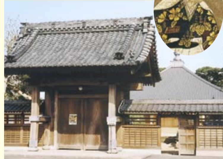
楞嚴寺と伝通院画像

文化財は私たち祖先のすぐれた文化活動の所産であり、そのひとつひとつがその土地の歴史と風土の中で育てられたものです。