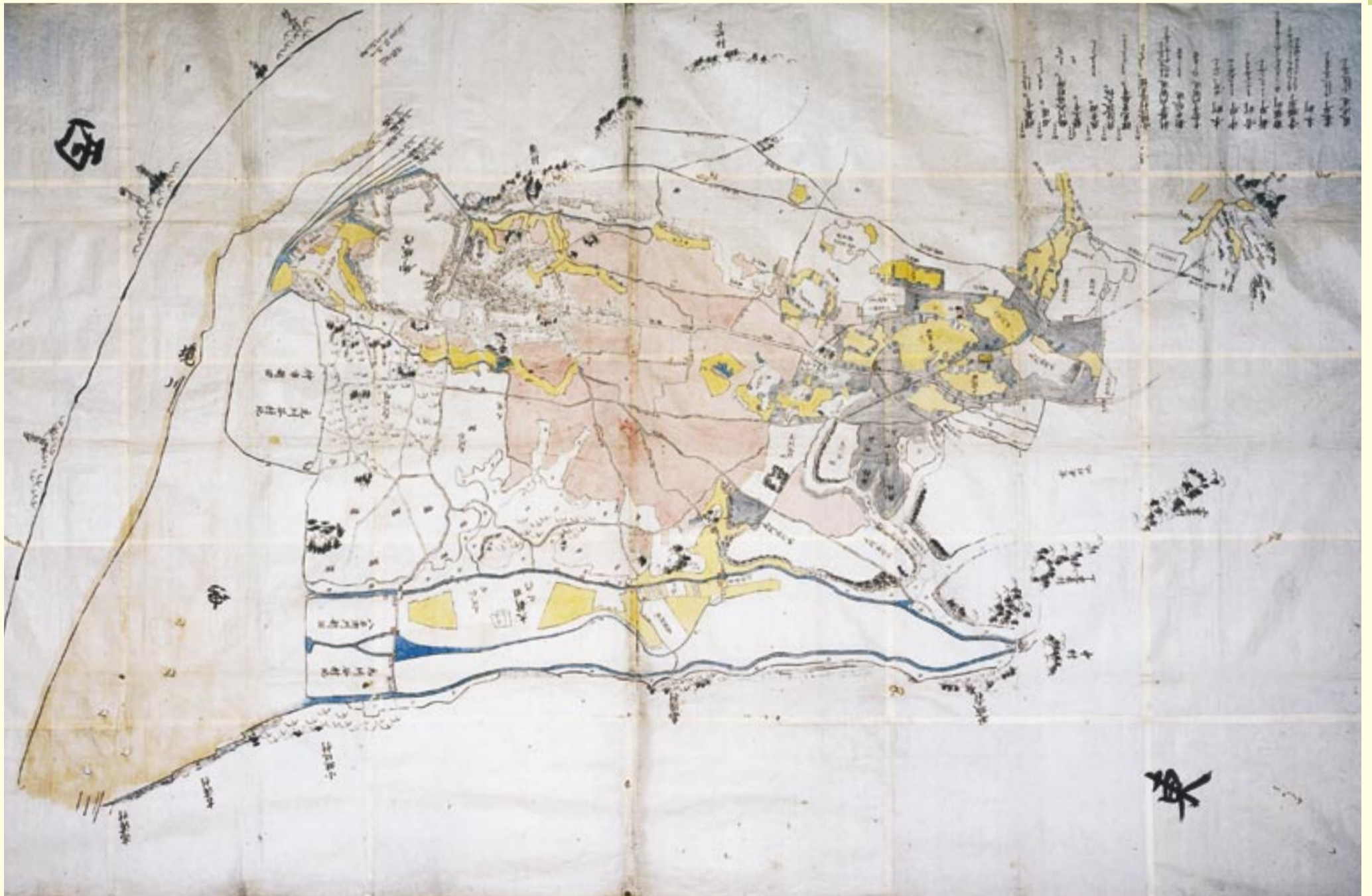
刈谷町・元刈谷村絵図